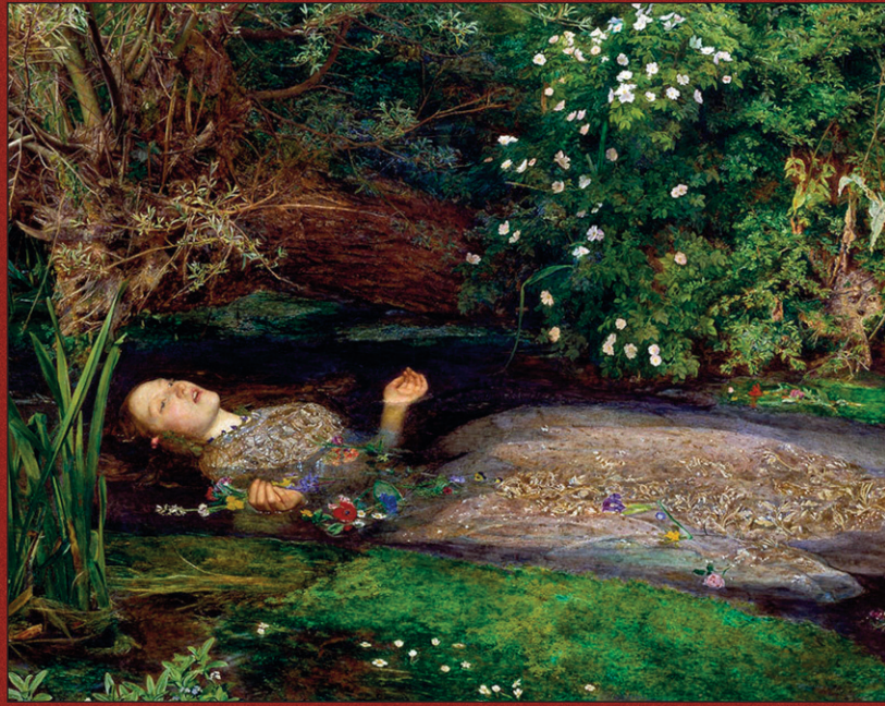
John Everett Millais, Ophelia , 1851, Tate Britain, London